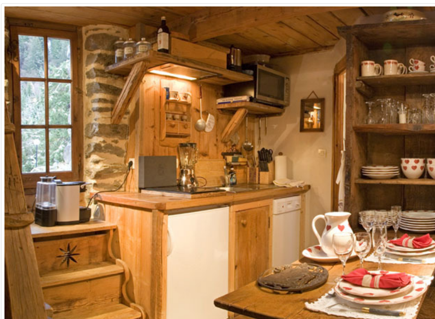
Coin Cuisine - Chalet LES CANTATES