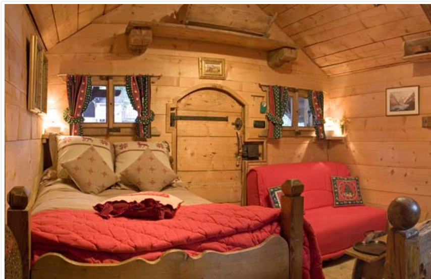
Coin nuit Chalet LES CANTATES - Chalets Philippe - Chamonix