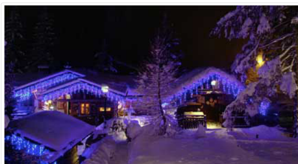
CHALETS PHILIPPE - Plateau du Lavancher - Chamonix