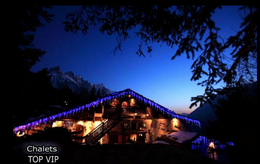
Chalets TOP VIP

700 route du Chapeau – Le Lavancher 74400 Chamonix Mont-Blanc Tél. 00 33 (0)6 07 23 17 26 - Fax 00 33 (0)4 50 54 08 28 Contact : Philippe COURTINES chaletsphilippe.com Email : contact@chaletsphilippe.com