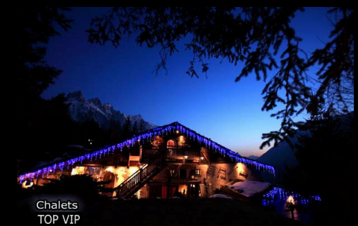
Chalets TOP VIP

700 route du Chapeau – Le Lavancher 74400 Chamonix Mont-Blanc Tél. 00 33 (0)9 72 58 47 70 - Fax 00 33 (0)4 50 54 08 28 Contact : Philippe COURTINES chaletsphilippe.com Email : contact@chaletsphilippe.com